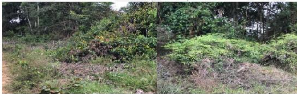
Figura 1. Suspensión de actividad de tala de bosque natural

En el recorrido por fuera y dentro del bosque se observó la suspensión de la actividad de tala de especies arbóreas, conservando el bosque natural permitiendo la regeneración natural de especies nativas de la zona.