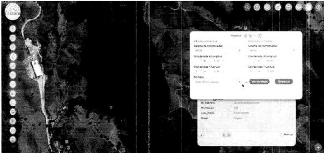
Figura 1. Georreferenciación predio PK: 5912005000000200118 Fuente: Geoportal Cornare, 2023.