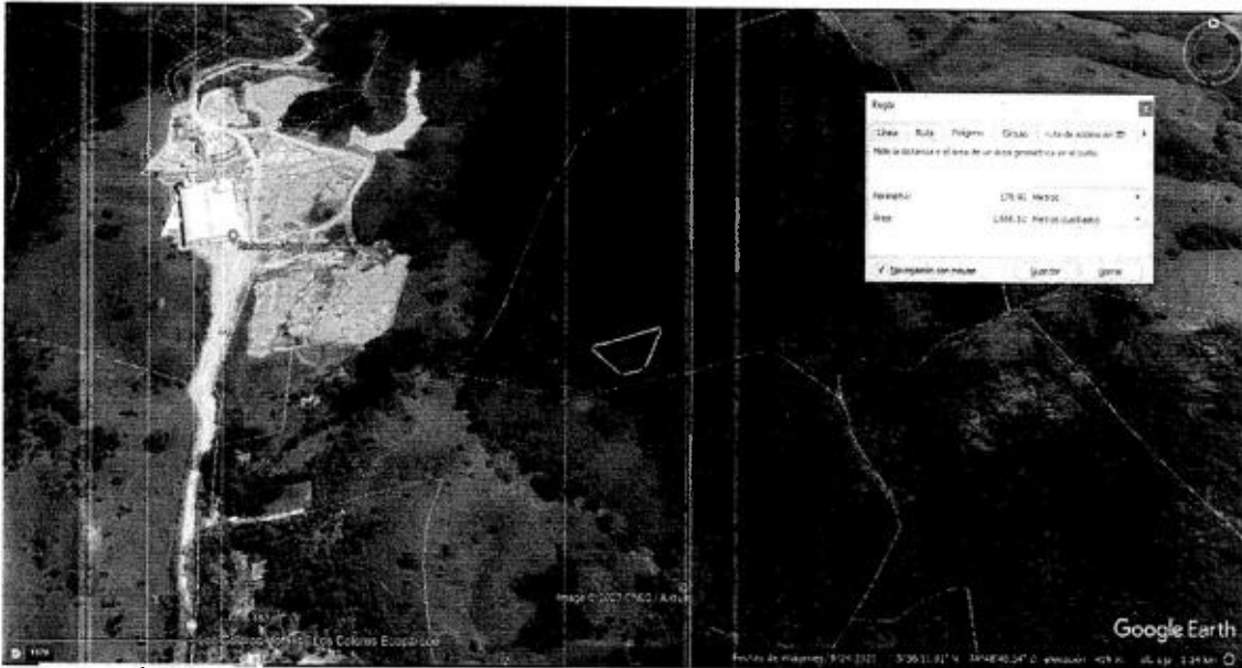
Figura 3. Área intervenida con tala rasa en predio ubicado en la vereda La Florida Tres Ranchos – Puerto Triunfo Ant.