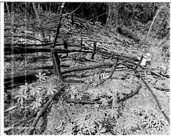
Figura 5. Área intervenida con tala rasa vereda La Florida Tres Ranchos Municipio de Puerto Triunfo.