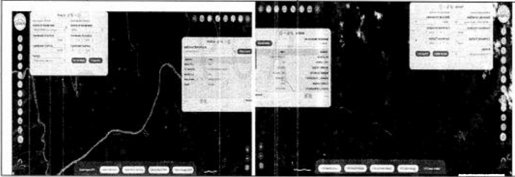
Imagen 1, Georreferenciación del predio de acuerdo a las coordenadas descritas en el Plan de Manejo e informes técnicos-Vereda San José- San Carlos