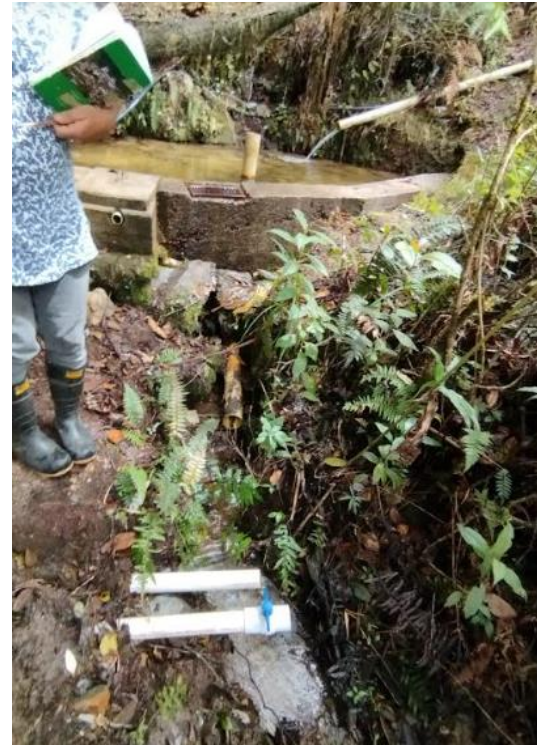
Figura 2. Obra de control implementada en campo

Otras situaciones encontradas en la visita: NA