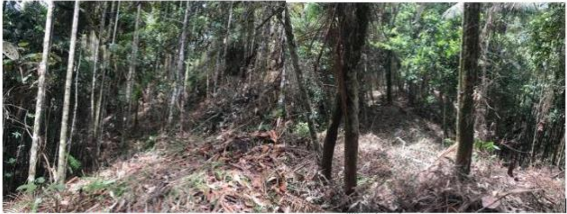
Figura 3. Área intervenida por socola

En el área socolada no se evidenció fuentes hídricas cercanas y/o material vegetal quemado. No se encontró personal realizando actividades de socola de bosque.