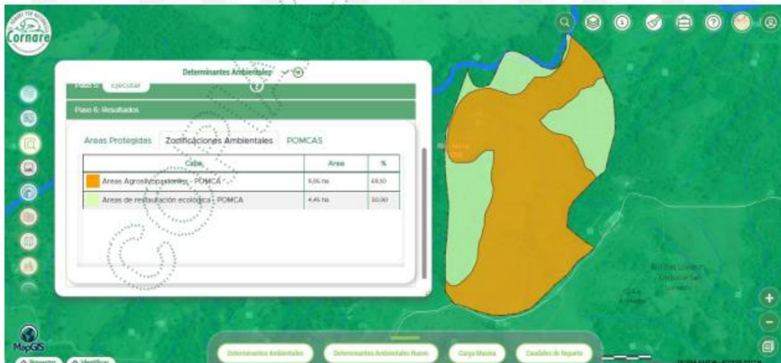
Figura 5. Determinante Ambientales

Consultado el Geoportal Interno de Cornare MapGIS, se puede determinar que el predio con FMI 026- 0012987, cuenta con determinantes Ambientales POMCAS, con áreas agrosilvopastoriles 0.97 Ha y áreas de restauración ecológica 4.45 Ha