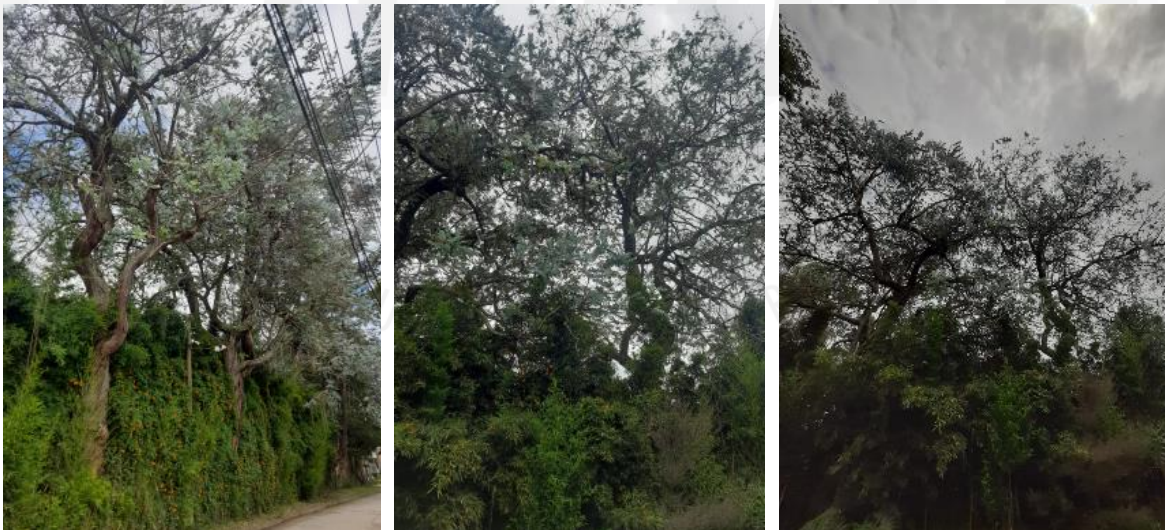
Imágenes 3, 4 y 5: Ubicación y estado de los árboles en cerco vivo.

En cuanto a los individuos que corresponden al cerco vivo, estos se localizan sobre el costado derecho de la portada, se ubican de forma lineal y paralela al lindero del predio respecto a la calle 30. Estos individuos presentan alturas que oscilan entre 16 y 18 metros y algunos presentan bifurcaciones en su fuste. Debido al tamaño y ubicación de los árboles, los residentes vecinos han solicitado su intervención debido al desprendimiento frecuente de ramas sobre la vía y redes eléctricas.