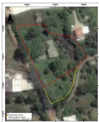
Imagen 6: Localización de los árboles respecto a los predios.

A continuación, se presenta una imagen de la localización de los árboles respecto a los predios, en naranja el Pino Pátula, en verde los cercos vivos: