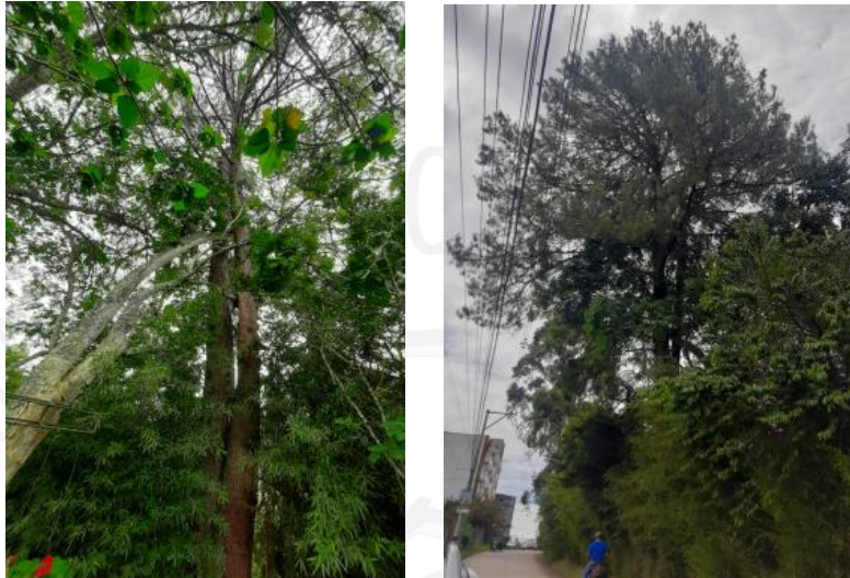
Imágenes 1 y 2: Ubicación y estado del Pino Pátula.

El Pino pátula corresponde a un individuo adulto de su especie que presenta una altura aproximada de 22 metros y un diámetro a la altura del pecho de 135 centímetros. Este árbol se localiza sobre costado izquierdo de la portada de la vivienda y se traslapa con las redes eléctricas. Pese a que el individuo presenta óptimas condiciones fitosanitarias y se observa recto, la interesada manifiesta que en repetidas ocasiones los residentes del frente le han solicitado su intervención por el riesgo que éste representa debido a su tamaño y cercanía con dichas viviendas.