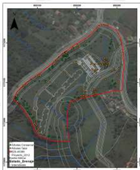
Imagen 3: Diseño y huella del proyecto.

Así las cosas, los árboles objeto de aprovechamiento forestal corresponden a ciento cincuenta y nueve (159) individuos que se ubican sobre las áreas requeridas para la construcción de las obras civiles, tal y como se observa en la siguiente imagen: