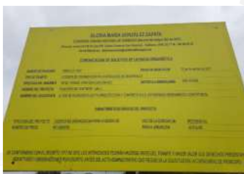
Imagen 1: Valla informativa sobre la solicitud de licencia urbanística.

De acuerdo con lo descrito en la solicitud, y lo manifestado durante el recorrido, en el predio se proyecta la construcción del proyecto inmobiliario denominado "Manantial", el cual consistirá en la construcción de torres de apartamentos de vivienda de interés social VIS., para esto, la parte interesada solicitó ante la curaduría urbana segunda, la respectiva licencia de construcción: