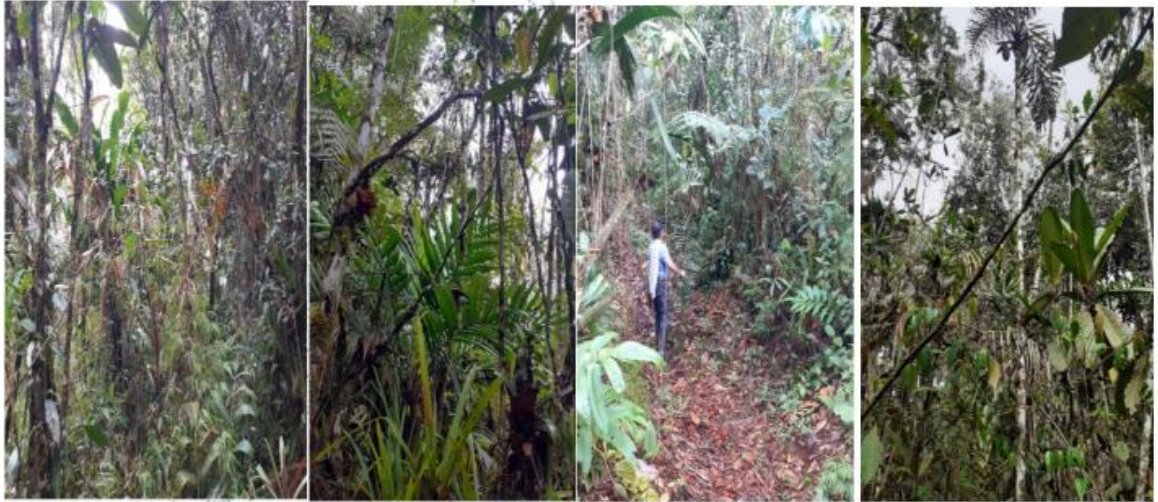
Imagen 2. Registro fotográfico del estado actual del predio.

Según la Resolución 135-0032 del 21/6/2007 por medio de la cual se autoriza un permiso de aprovechamiento forestal único de un bosque natural, se autorizó el aprovechamiento de 25,189m 3 de las siguientes especies, Macana 1.25m 3 , Borrajo 4.77m 3 , Gallinazo 5.16m 3 , Guacamayo 4.92m 3 , Carate 4.06m 3 , Laurel 3,666m 3 , Cirpe 1,338m 3 : El recorrido se realizó por varios puntos del predio, evidenciándose el bosque en buen estado, sin intervención alguna, las especies autorizadas seguían en pie, en el suelo no se observó ramas o cogollos que hubiesen dado pruebas de haberse realizado el aprovechamiento, como tampoco residuos de ramas secas y demás.