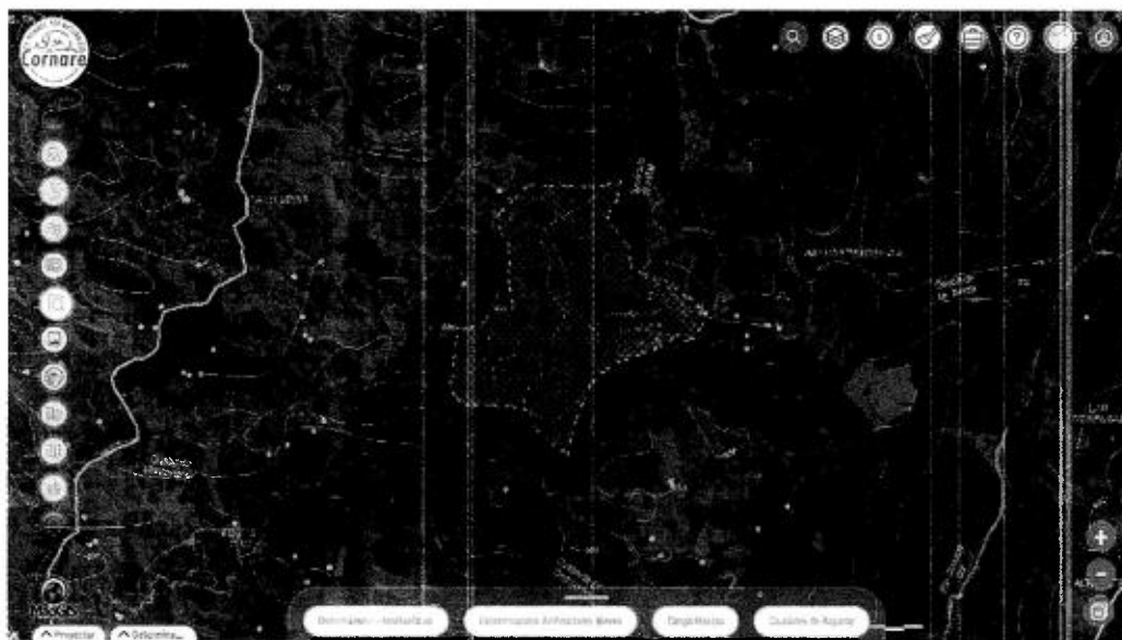
Figura 1. Predio con PK 6602002000000700012. Geoportal de Cornare 2023.