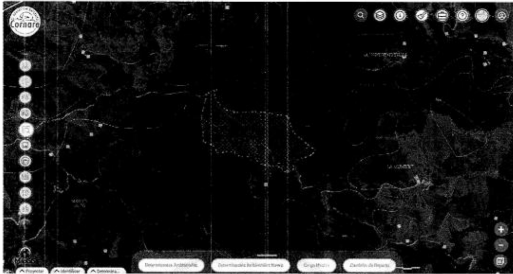
Figura 2. Predio con PK 6602002000000600008. Geoportal de Cornare 2023

25.2. El informe de control y seguimiento No. 134-0219 del 01 de julio de 2011, indica que durante la visita llevada a cabo el día 28 de junio de 2011 por los técnicos de la Corporación, se observaron caminos por donde se ha extraído la madera, sitios de aserrado y acopio de productos dentro del bosque, que evidencian que se está realizando un aprovechamiento forestal en el lugar. Además, en diferentes sitios del bosque se encuentran tocones con diámetros mayores a 35 cm.