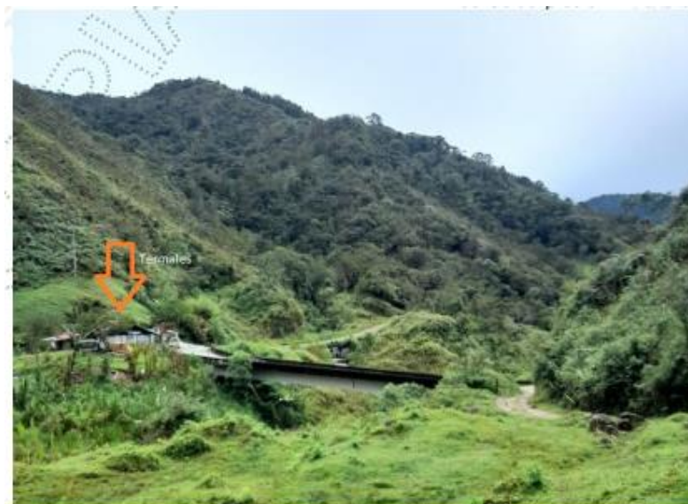
Fotografía 3. Punto de referencia del sitio