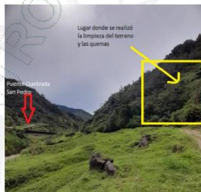
Fotografía 2. Sitio donde se realizó la limpieza del terreno dentro del predio FMI: 026-0010597.