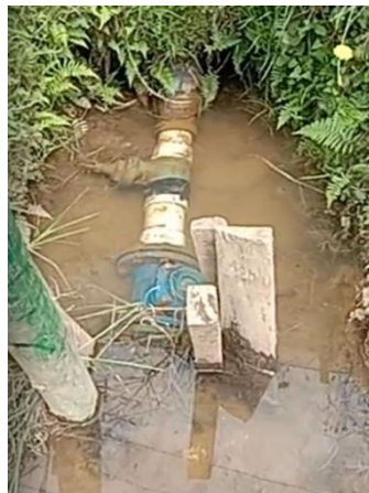
Registro fotográfico N°1

Por otro lado, en la actualidad el acueducto tiene instalado un macro medidor que esta averiado a la salida del tanque de bombeo y entrada del tanque de almacenamiento principal (por favor ver anexo fotográfico N° 1 ) y no se cuenta con los recursos económicos para su reposición, la adquisición e instalación de nuevos macro medidores, mismos que se tienen incluidos en dicho plan de mejora a ser aprobado por la próxima asamblea general de asociados.”