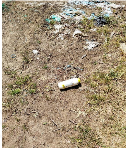
Envases de agroquímicos con mala disposición en el predio