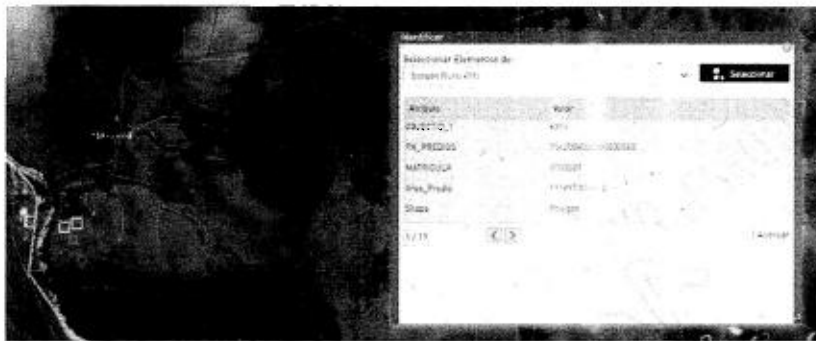
Imagen 1. Predio con FMI 028-520 Fuente: Geoportal interno de Cornare