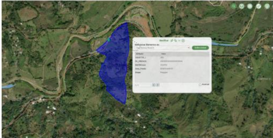
Imagen 1. Ubicación predio de la actividad