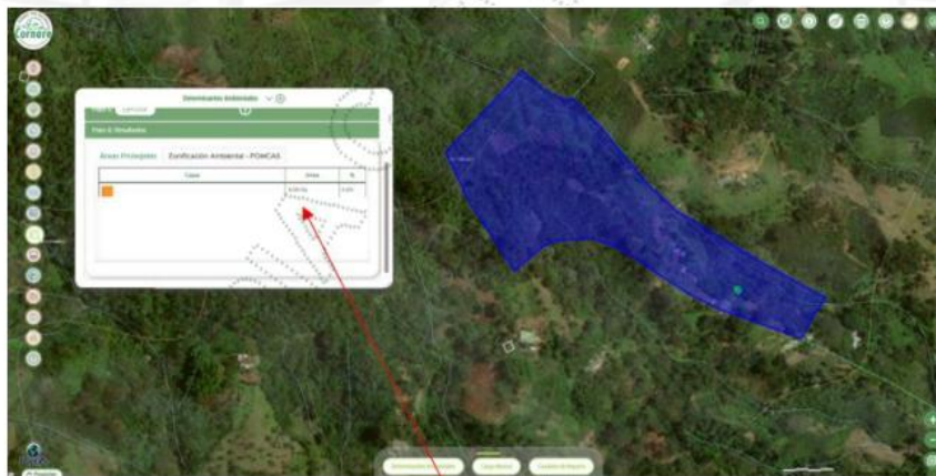
Consultado el Geoportal interno de CORNARE MapGIS, se puede evidenciar que el predio no se encuentra de los polígonos del POMCA ni los SIRAP.