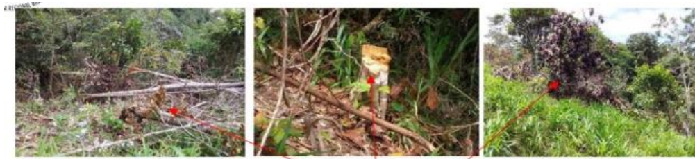
Imágenes del área, y los árboles talados