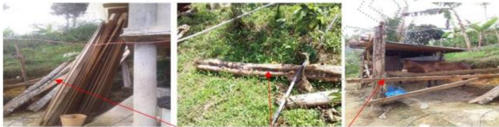
Imágenes de la madera aprovechada, y zona objeto de la construcción de la marquesina.