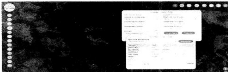
Figura 1. Georreferenciación predio PK: 6522002000001600015