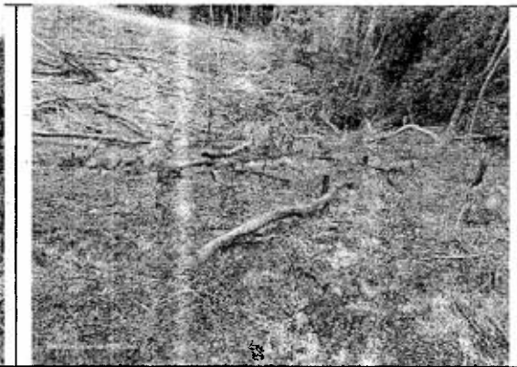
Figura 5. Área intervenida con socola y quema.

3.5 Otras observaciones. De acuerdo a la información proporcionada por el propietario del predio, este realizó la compra del predio en diciembre del año 2022. En el momento de la visita se pudo observar que el propietario del predio vive con dos menores en un grupo familiar con evidentes necesidades básicas insatisfechas, no tienen vivienda digna, no tienen acceso a servicios básicos como agua y energía eléctrica.