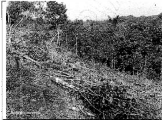
Figura 4. Área intervenida con socola y quema.