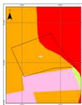
Imagen 2: Zonificación ambiental predio 020-74530.