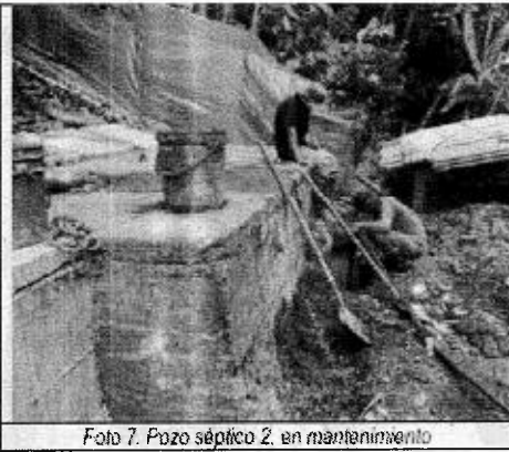
Foto 7. Pozo séptico 2, en mantenimiento