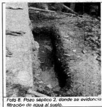
Foto 8. Pozo séptico 2, donde se evidencia filtración de agua al suelo.