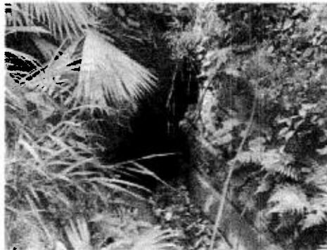
Foto 2. Salida del efluente del pozo séptico 1 sobre cuneta de aguas lluvias.