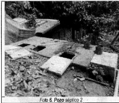
Foto 6. Pozo séptico 2