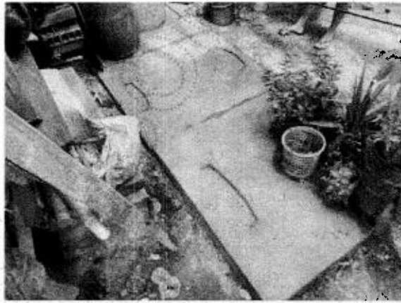
Foto 1. Localización pozo séptico 1, ubicado en patio de una vivienda

toda vez que se encuentra en el patio de una de las casas (ver foto1), dicho sistema, fue instalado por parte del municipio de Puerto Triunfo hace aproximadamente veinte (20) años, para recibir las aguas residuales domésticas de cuatro (4) viviendas y debido al incremento de la población en el sector ya se encuentran conectadas cinco (5) viviendas más, según información tomada en campo, lo que ha ocasionado que en algunas ocasiones el sistema séptico colapse y se rebose, afectando a las personas que viven cerca del lugar.