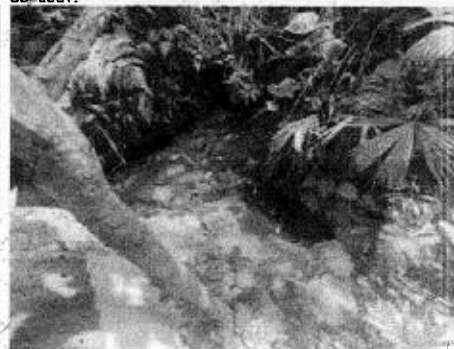
Foto 5. Contraste del vertimiento que descarga sobre la fuente hídrica "sin nombre" localizada en las coordenadas -74^{\circ}47'57.9''W , 5^{\circ}55'1.56''N