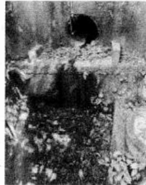
Foto 3. Descole de obra transversal de la vía que conduce aguas lluvias y además está recibiendo ARD del pozo séptico.