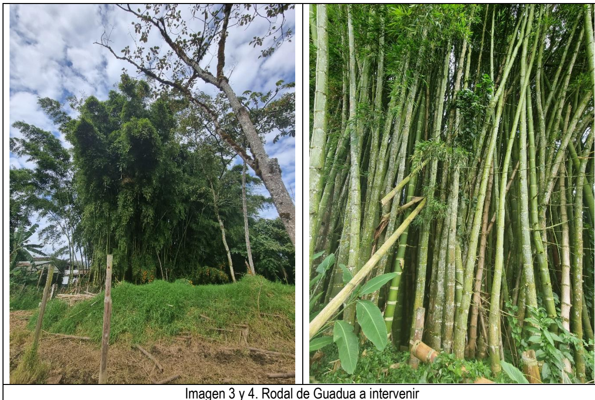
Imagen 3 y 4. Rodal de Guadua a intervenir