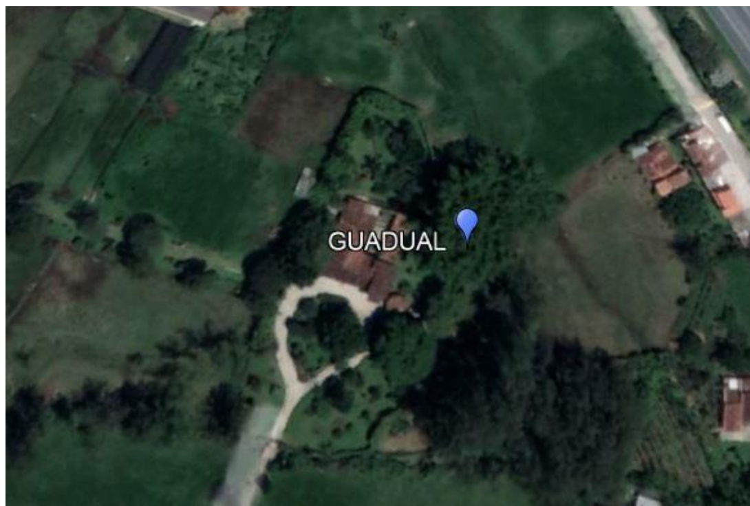
Imagen 1. Ubicación rodal de Guadua

3.4 El guadual se encuentra a un costado del predio de interés: