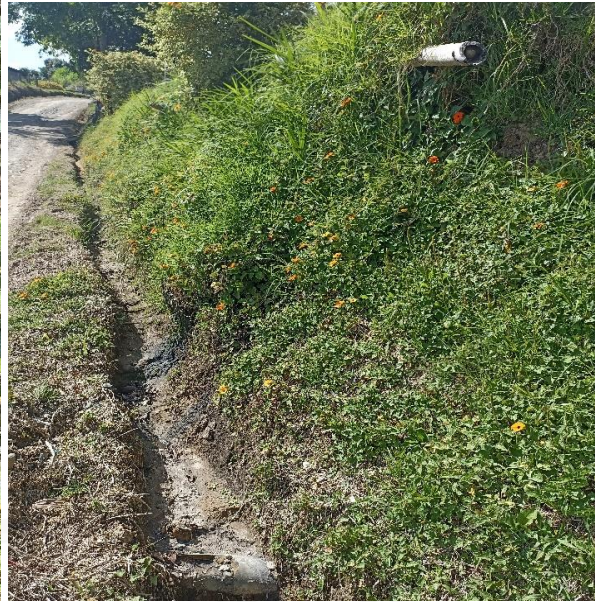
Punto de vertimiento de aguas residuales