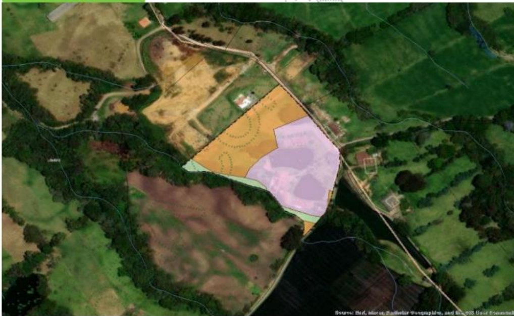
Mapa Area de Análisis

De acuerdo a la zonificación ambiental del POMCAS el 41.92% del predio son Areas Agrosilvopastoriles, el 52.16% son Areas de recuperación para uso múltiple y el 5.92% del predio se encuentra en Areas de restauración ecológica.