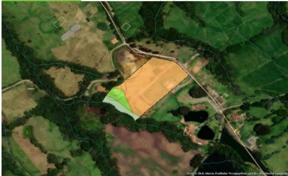
Mapa Area de Análisis

De acuerdo a la zonificación ambiental del POMCA el 82.82% del predio son Areas Agrosilvopastoriles, el 9.02% son Areas de importancia Ambiental y el 8.16% del predio se encuentra en Areas de restauración ecológica.