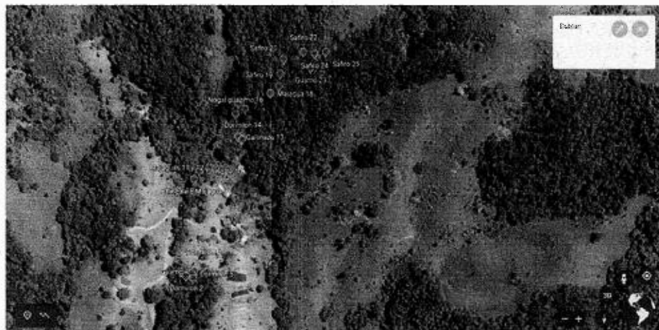
Figura 2. Distribución de los árboles a aprovechar.

3.4. Al realizar el recorrido por el predio se identificaron y marcaron con pintura los árboles objeto de la solicitud de aprovechamiento, los cuales corresponden a 25 individuos (Figura 2) de las especies Dormilón ( Vochysia ferruginea ), Guamo churimo ( Inga alba ), Chingalé ( Jacaranda copaia ), Majagua ( Rollinia pittieri ), Gallinazo ( Pollalesta discolor ), Nogal guácimo ( Huberodendrum sp ), Zafiro ( Pera colombiana ) y Oreja Mula ( Caladium sp ). Se procedió, por lo tanto, a verificar los diámetros a la altura del pecho – DAP y alturas totales de los árboles con el fin de calcular el volumen, la información obtenida se observa en la Tabla número 1.