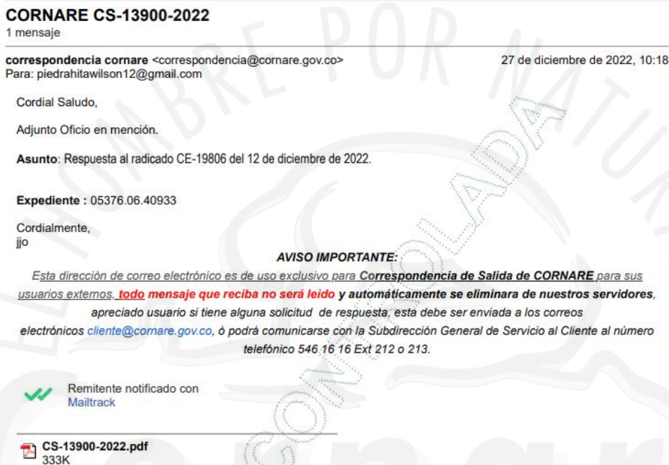
IMAGEN NOTIFICACION CORREO

5-Mediante Comunicación Interna CI-00170-2023 del 01 de febrero del año 2023, se solicita el desistimiento tácito de la solicitud CE-16627-2022 del 12 de octubre del año 2022, dado que no cumplió con los requisitos establecidos en los oficio CS-11022-2022 fechado el 27 de octubre del año 2022 y CS-13900-2022 del 26 de diciembre del año 2022.