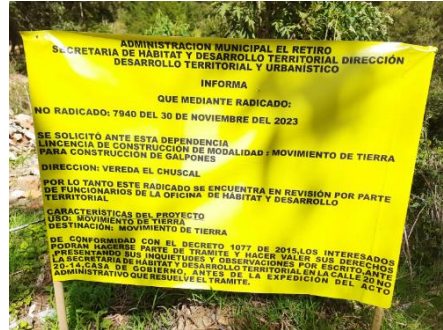
Imagen 1: Valla informativa.

Los individuos del 6 al 16 se ubican sobre una zona con cobertura en pastos limpios en la que se pretende realizar un movimiento de tierras para la construcción de un galpón, para esto, la parte interesada solicitó ante la Secretaría de Hábitat y Desarrollo Territorial del Municipio de El Retiro, el permiso de movimiento de tierras: