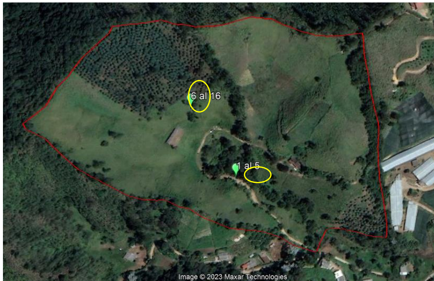
Imagen 2: Imagen satelital del predio con la ubicación de los árboles.

Estos individuos se encuentran dispersos en medio de coberturas de pastos limpios, no se encuentran asociados a linderos con predios vecinos y, pese a que la cartografía demarca la presencia de fuentes hídricas en el predio, estos no se ubican cerca de cauces o flujos de agua superficiales.