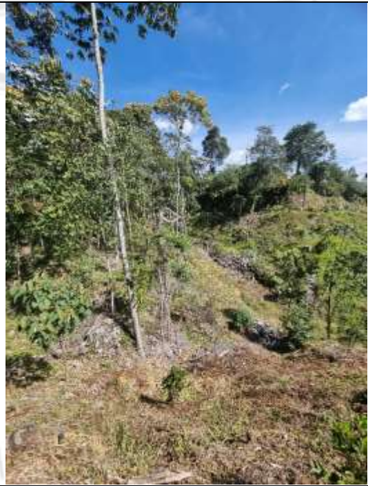
Imagen 2. Residuos vegetales que aún quedan en el predio en área de influencia de afluentes que discurren por el lote

Se resalta también las siguientes observaciones plasmadas en el informe técnico mencionado: