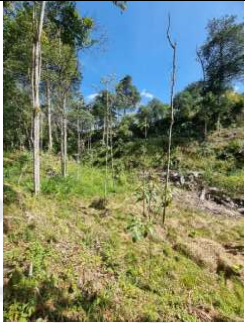
Imagen 1. Zonas revisadas donde de acuerdo con el usuario se realizó la siembra de árboles nativos como compensación, no obstante, no se evidencian arboles marcados o con plateos que coincidan con las especies informadas como establecidas en el área de interés