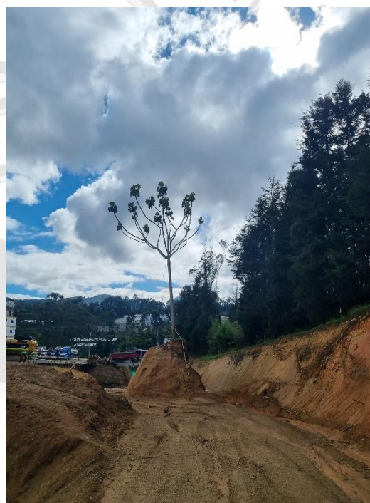
Imagen 3. Individuos a intervenir