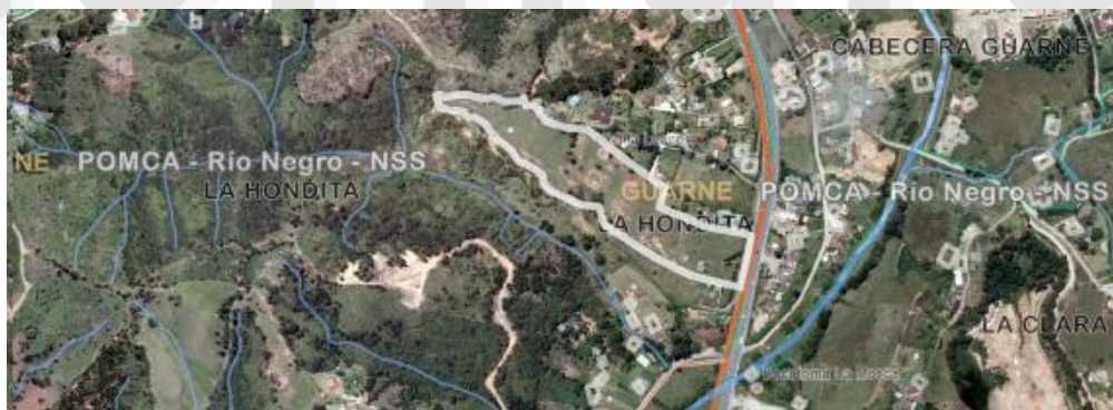
Imagen 1. Ubicación predio interés

3.2 En cuanto al predio donde se ubican los árboles: Se encuentra ubicado en la vereda La Hondita del municipio de Guarne, presenta un paisaje de altiplanicie y un relieve de lomas y colinas, además, hace parte del corredor suburbano de comercio y servicios de apoyo a las actividades turísticas y residenciales, y polígono de parcelaciones como área de vivienda campestre tradicional la Brizuela. El objetivo del aprovechamiento es adecuar el espacio para continuar con movimiento de tierras y construcción de bodegas.