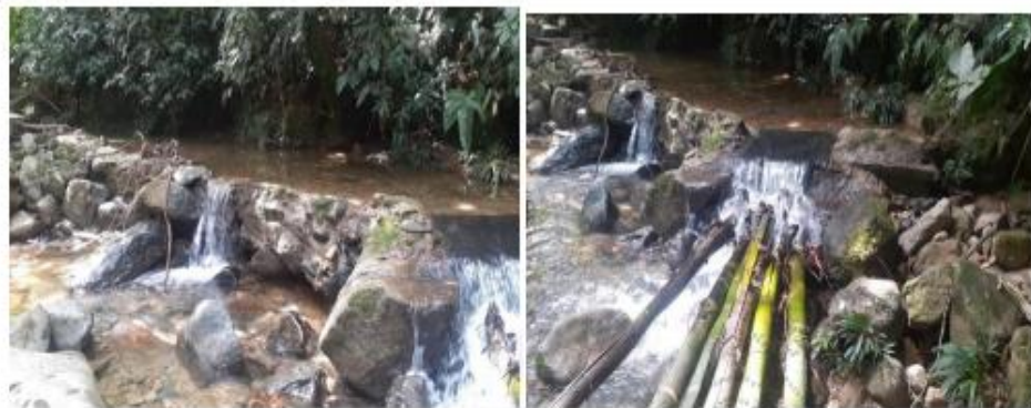
Imagen 1. Fuente de agua y bocatoma Q La Granja.