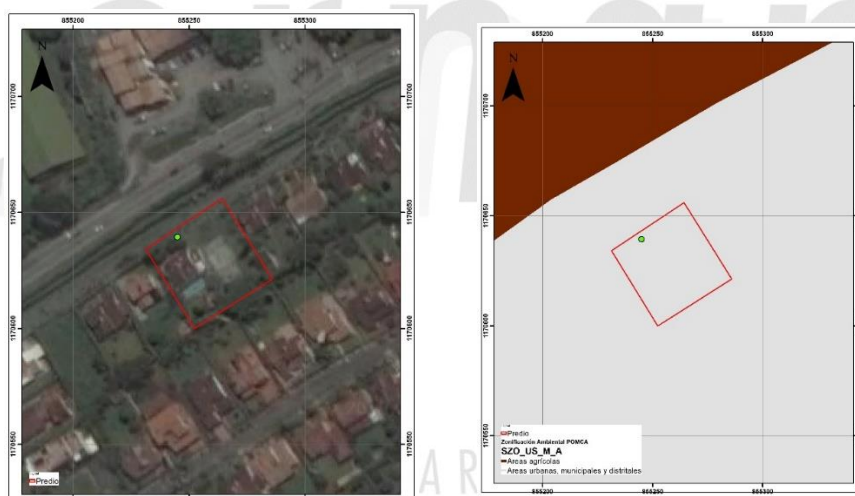
Imágenes 6 y 7: Localización y zonificación del predio.

De acuerdo con el Sistema de Información Geográfica de Cornare, el predio hace parte del área delimitada por el Plan de Ordenación y Manejo de la Cuenca Hidrográfica POMCA del Río Negro, aprobado en Cornare mediante la Resolución No. 112-7296 del 21 de diciembre de 2017, modificada por la Resolución RE-04227 del 1 de noviembre de 2022, por encontrarse sobre las áreas de uso múltiple: