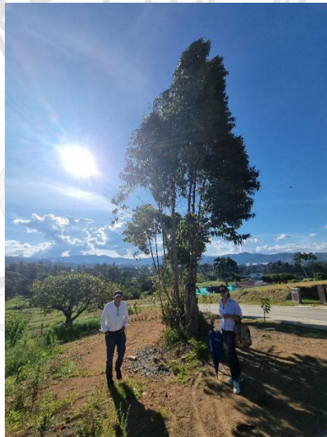
Imagen 2. Individuos a intervenir