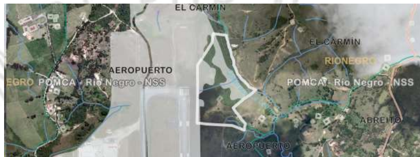
Imagen 1. Ubicación predio adicional

En cuanto al predio donde se ubican los árboles: El predio se encuentra ubicado en la vereda Aeropuerto del municipio de Rionegro, presenta un paisaje de altiplanicie y un relieve de lomas y colinas, además, hace parte de un módulo suburbano de interés económico del aeropuerto, conforme el POT del municipio.