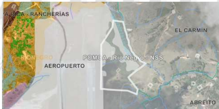
Imagen 2. Determinantes ambientales predio interés

En cuanto a los individuos arbóreos de interés: se ubican cerca a la pista del aeropuerto, obstaculizando el normal desarrollo de las actividades de las aeronaves. Adicionalmente, el predio donde se ubican los árboles presenta las siguientes determinantes ambientales. Se encuentra al interior de los límites del Plan de Ordenación y Manejo de la Cuenca Hidrográfica POMCA del Río Negro, aprobado en Cornare mediante la Resolución No. 112-7296 del 21 de diciembre de 2017 y mediante la Resolución No. 112-4795 del 8 de noviembre de 2018, estableció el régimen de usos, además, por medio de la resolución RE-04227-2022 del 1 de noviembre de 2022 se modifica el régimen de usos al interior del predio en áreas urbanas (100%).