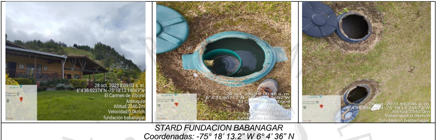
STARD FUNDACION BABANAGAR Coordenadas: -75° 18' 13.2" W 6° 4' 36" N

Por tanto, el predio corresponde a una vivienda rural dispersa y cuenta con un sistema conformado con trampa de grasas, tanque séptico y filtro anaerobio de flujo ascendente, el diseño cumple con las disposiciones establecidas en la Resolución 330 del 2017- RAS. El sistema realiza vertimiento al suelo mediante campo de infiltración, conforme al siguiente registro fotográfico: