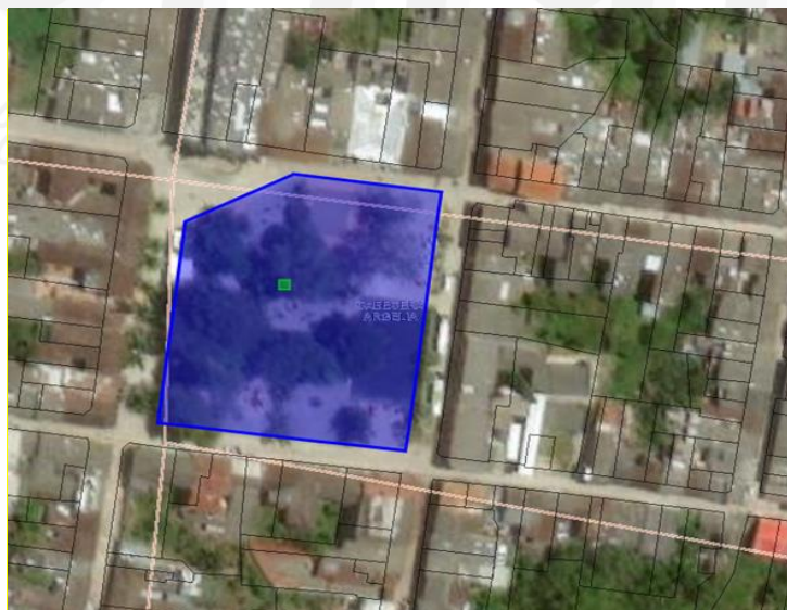
Imagen 1: Ubicación del predio.

El predio denominado Parque principal del municipio de Argelia, con FMI No 028-28032, de acuerdo con el sistema de información de CORNARE, tiene un área de 0.53 hectáreas. El predio se encuentra ubicado en la cabecera municipal, Carrera 30 # 30-20.