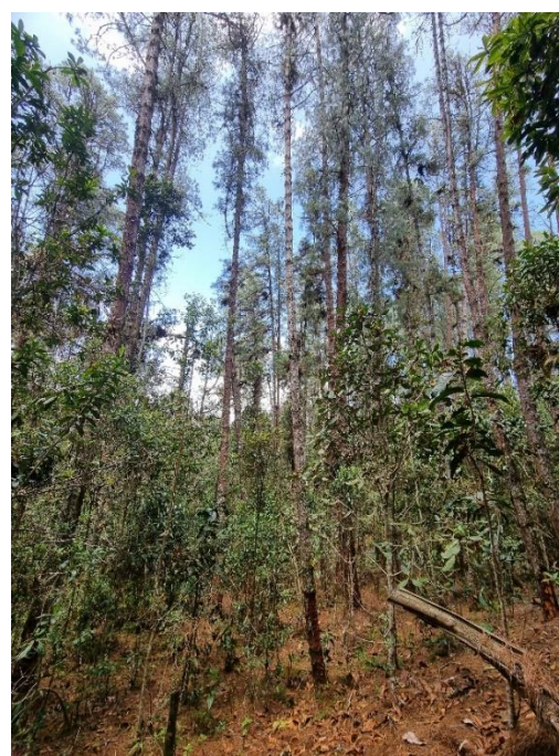
Imágenes. Zonas plantadas