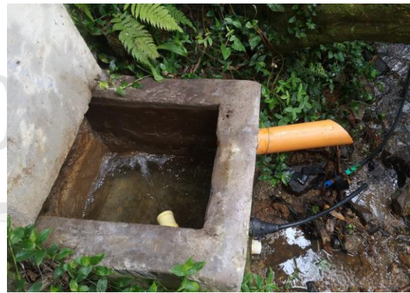
Imagen 2. Adecuaciones realizadas

Se realizó aforo volumétrico en la tubería que trae el recurso al tanque del cual se distribuye al predio y se devuelve el rebose a la fuente, para verificar el cumplimiento del caudal captado, encontrando que el usuario deriva de la fuente 0.0381 L/sg, caudal similar al otorgado por Cornare.