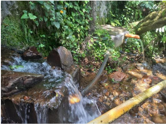
Imagen 1. Obra de captación y control

Al lado del tanque de captación se construyó un segundo tanque para el control del caudal que pasa al predio, en este se instaló la tubería de dos pulgadas (2") con tapón perforado con broca de 3/8", de este se desprende tubería de media pulgada (1/2") hasta el predio y otra de tres pulgadas (3") devolviendo el rebose a la fuente de agua, de acuerdo con el diseño entregado por Cornare para obra de captación y control para caudales menores a 1 L/sg. en mampostería.