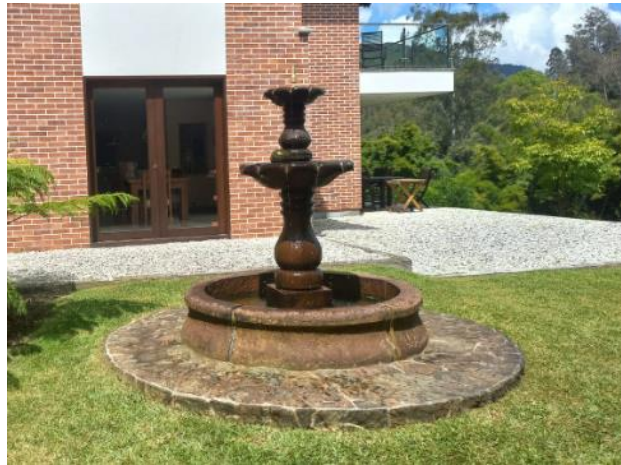
Imagen 4. Fuente decorativa.