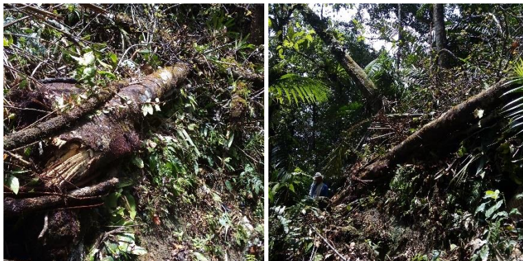
Arboles viejos caídos obstruyendo el camino