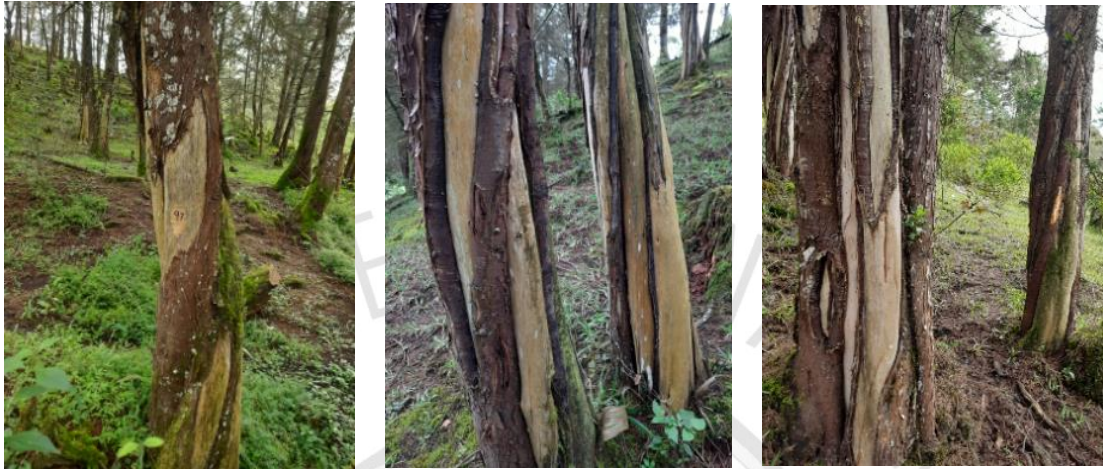
Estado de la corteza de la mayoría de los árboles

Los árboles corresponden a individuos aislados de las especies maderables en estadios juveniles y adultos, que presentan en su totalidad, afectación en el fuste debido al consumo por parte el ganado bovino de la corteza, lo que ha generado secamientos parciales y totales de muchos árboles y afectaciones fitosanitarias en otros.