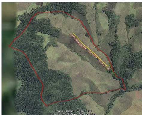
Imagen 2: Imagen satelital año 2004.

Los árboles se ubican sobre una ladera de pendiente alta a moderada en medio de coberturas en pastos limpios que, según lo observado en imágenes satelitales históricas, se han conservado en pastos limpios desde hace más de 15 años tal y como se muestra en las siguientes imágenes, en la que, además, se observan los polígonos en los que se ubican los árboles objeto de aprovechamiento.