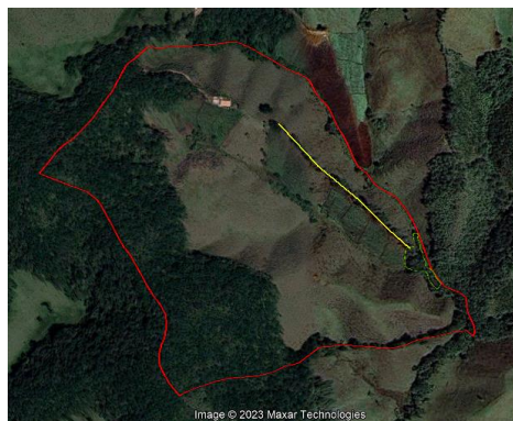
Imagen 3: Imagen satelital año 2018.