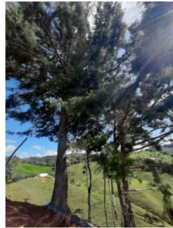
Árboles de cerca viva