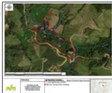
Localización de las parcelas de monitoreo de la reubicación de epifitas.