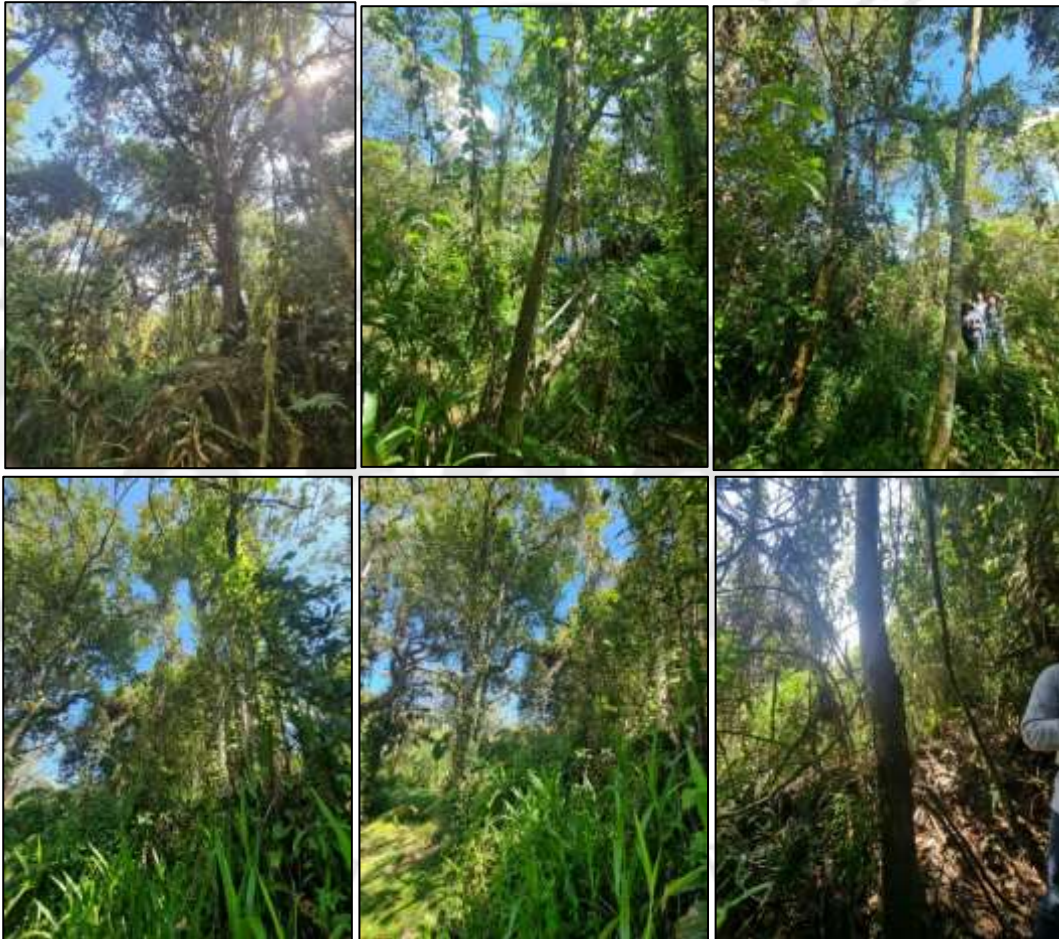
Fotografías obtenidas durante la visita realizada el día 23 de octubre de 2023 al Acueducto las Mercedes.