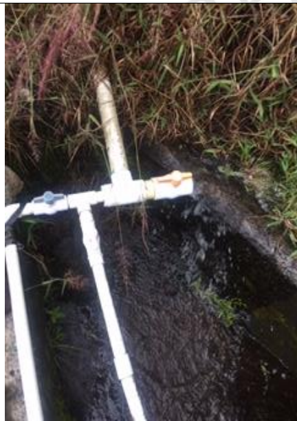
Imagen 2: Sistema de control de caudal