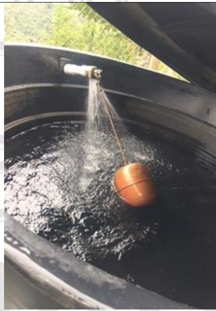
Imagen 3: Tanque De Almacenamiento dotado con dispositivo control de flujo (flotados)