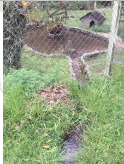
Imagen 5: Lago para Uso Ornamental.