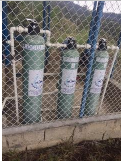
Imagen 4: Sistema de Riego