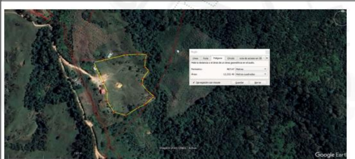
Figura 2. Area instaurada en potreros y cultivos resultado de roceria y quema de bosque nativo. Vereda Potrerros Municipio de Cocornà . Ant.

Al continuar con el recorrido por la parte nororiental del predio, informa la propietaria del lote vecino identificado con PK 197200100000700164, Lina María Castro Tejada identificada con cedula de ciudadanía número 1.037.595.593 que el señor Orlando León Muñoz Correa realizo la siembra de 220 árboles tipo bosque protector en la parte nororiental del predio hace aproximadamente dos años. Al recorrer el área señalada en las coordenadas geográficas 6°05'37.71" N - 75°12'35.51" W se observa la resiembra de aproximadamente 100 árboles de las especies Chirlobirlo, matarratón, Escobo, Nogal cafetero, Nacadero, alcaparro enano, pitanga o grosella, jazmín, sauco) como se observa en las siguientes figuras: