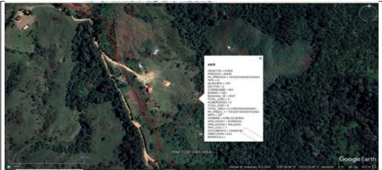
Figura 1. Area total del predio afectado por roceria y quema de bosque nativo. Vereda Potrerros. Municipio de Cocornà . Ant. Imágenes Geoportal Cornare 2023.