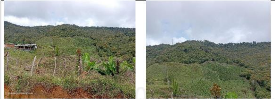
Figura 3 y 4. Areas instaladas en potreros y cultivos despues de roceria y quema de bosque nativo. Vereda Potrerros. Municipio de Cocornà . Ant. 2023.