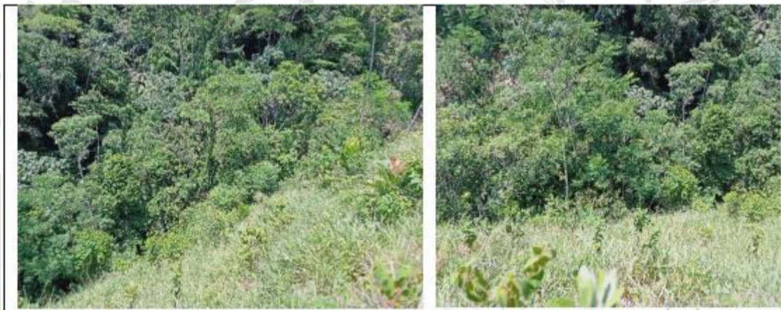
Figura 2 y 3. Franjas de protección quebrada Auroscuro predio con PK 522002000002000065. Vereda Alta Municipio de San Francisco . Ant. 2023.