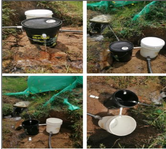
Ejemplo de obra control de caudal económica (diseño)