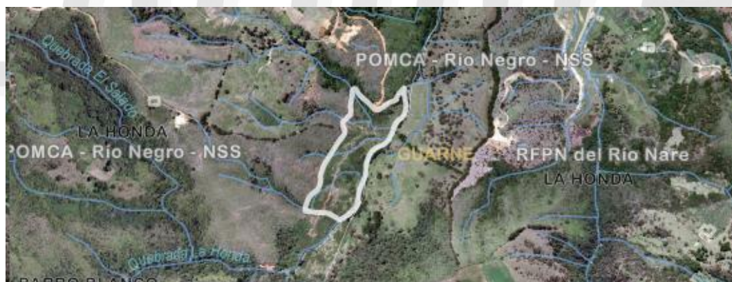
Imagen 1. Ubicación predio de interés

3.2 En cuanto al predio donde se ubican los árboles: Se encuentra ubicado en la vereda La Honda del municipio de Guarne, presenta un paisaje de montaña y un relieve de filas y vigas. El objetivo del aprovechamiento es comercializar la madera producto del apeo y permitir el desarrollo de las especies que vienen creciendo bajo dosel.