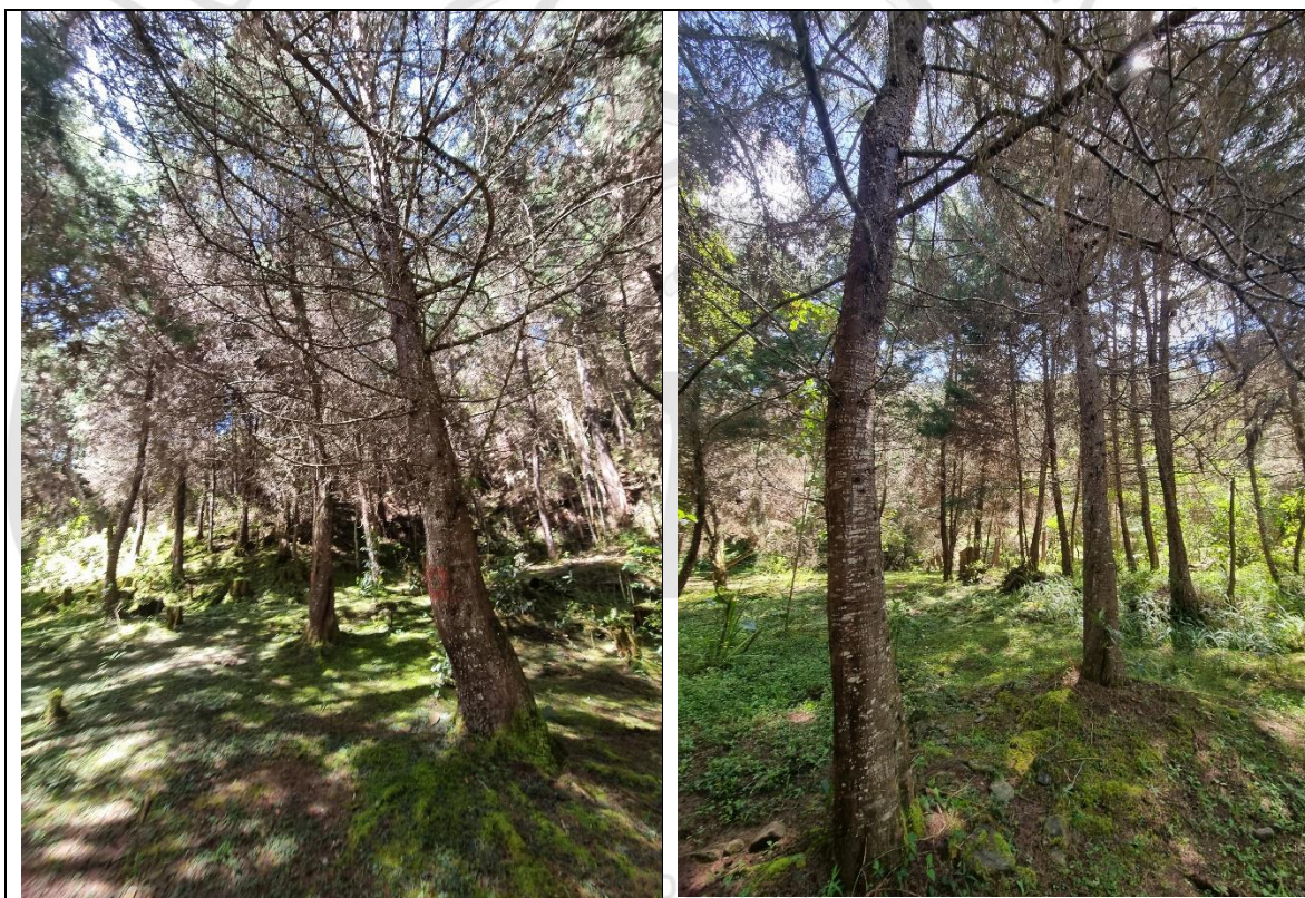
Imagen 3 y 4. Individuo arbóreo a intervenir