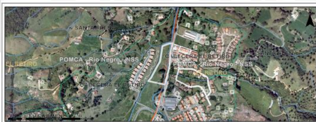
Imagen 1. Ubicación predio de interés

3.2 En cuanto al predio donde se ubican los árboles: corresponde al FMI 017-41838, espacio público (Parque Lineal), ubicado en zona urbana de propiedad del Municipio de El Retiro, hace parte de la zona de retiro de la Quebrada La Agudelo, principalmente con cobertura de pastos arbolados.