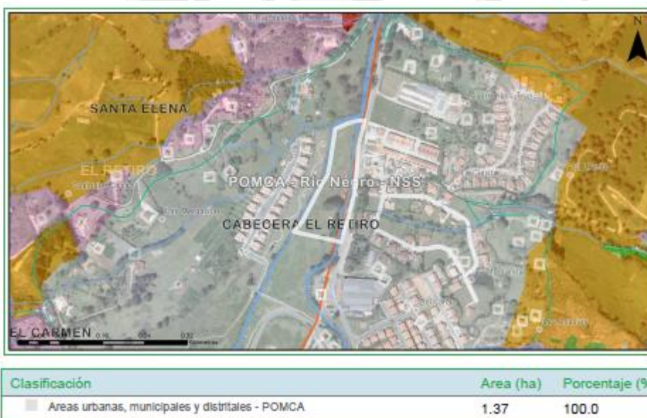
Imagen 2. Determinantes ambiental predio de interés

3.5 Localización de los árboles aislados a aprovechar con respecto a Acuerdos Corporativos y al sistema de Información Ambiental Regional: De acuerdo con el Sistema de Información Geográfica de Cornare, el predio de interés, se encuentra al interior de los límites del Plan de Ordenación y Manejo de la Cuenca Hidrográfica POMCA del Río Negro, aprobado en Cornare mediante la Resolución No. 112-7296 del 21 de diciembre de 2017 y mediante la Resolución No. 112-4795 del 8 de noviembre de 2018, estableció el régimen de usos, además, por medio de la resolución RE-04227-2022 del 1 de noviembre de 2022 se modifica el régimen de usos al interior del predio en: áreas urbanas (100%).