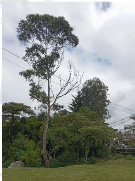
Imagen 2. Árboles objeto de la solicitud