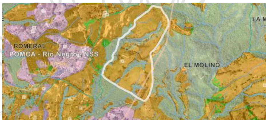
Imagen 2. Determinantes ambientales predio de interés

3.4 Localización de los árboles aislados a aprovechar con respecto a Acuerdos Corporativos y al sistema de Información Ambiental Regional: De acuerdo con el Sistema de Información Geográfica de Cornare, el predio de interés, se encuentra al interior de los límites del Plan de Ordenación y Manejo de la Cuenca Hidrográfica POMCA del Río Negro, aprobado en Cornare mediante la Resolución No. 112-7296 del 21 de diciembre de 2017 y mediante la Resolución No. 112-4795 del 8 de noviembre de 2018, estableció el régimen de usos, además, por medio de la resolución RE-04227-2022 del 1 de noviembre de 2022 se modifica el régimen de usos al interior del predio en: áreas de importancia ambiental (0,26%), de restauración ecológica (19,67%) y agrosilvopastoriles (80,07%).