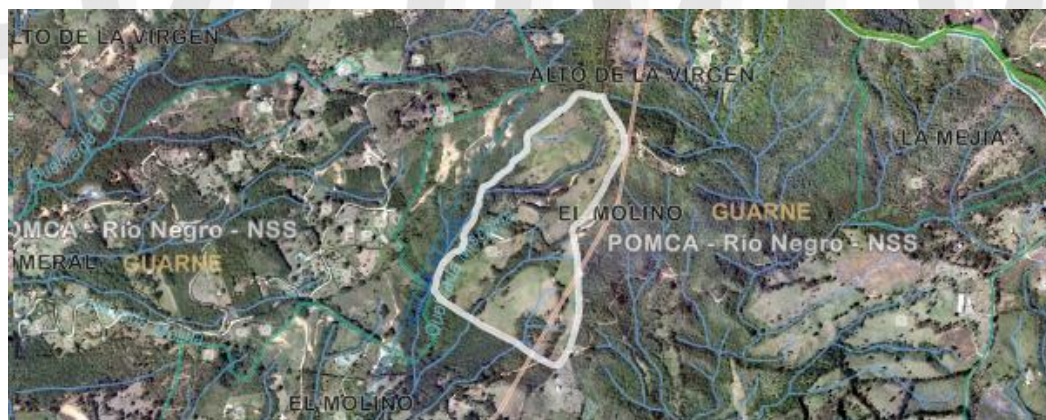
Imagen 1. Ubicación predio de interés

3.2 En cuanto al predio donde se ubican los árboles: Se encuentra ubicado en la vereda El Molino del municipio de Guarne, presenta un paisaje de montaña y un relieve de filas y vigas. El objetivo del aprovechamiento es prevenir accidentes ya que la caída de hojas y ramas ha afectado la vía interna, además, se teme por el volcamiento de algún individuo y que afecte el cultivo de aguacate.