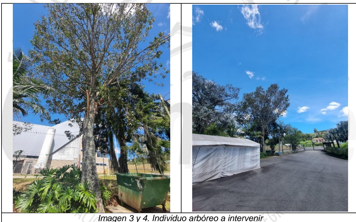
Imagen 3 y 4. Individuo arbóreo a intervenir