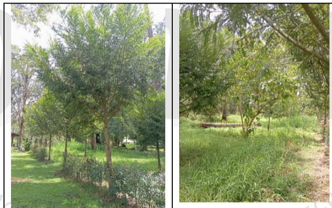
Imagen 2. Árboles sembrados en compensación.