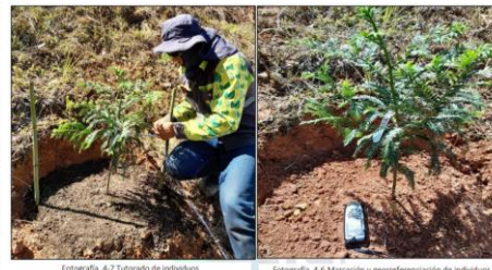
Fotografía 4-7 Tutorado de individuos