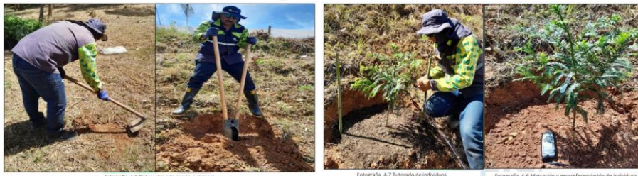
Fotografía 4-3 Plateo y hoyado previo a siembra