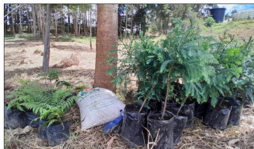
Fotografía 4-1 Material vegetal empleado en la siembra