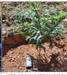
Fotografía 4-6 Marcar y georeferenciar de individuos