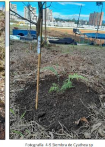
Fotografía 4-9 Siembra de Cylthea sp. (Inéctico arbóreo)

En virtud de lo anterior, a continuación se resumirán las verificaciones de cumplimiento de las resoluciones ambientales: