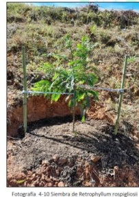
Fotografía 4-10 Siembra de Retophyllum rospigliosi (Pino Rionegro)