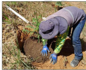
Fotografía 4-4 Aplicación de tierra abonada