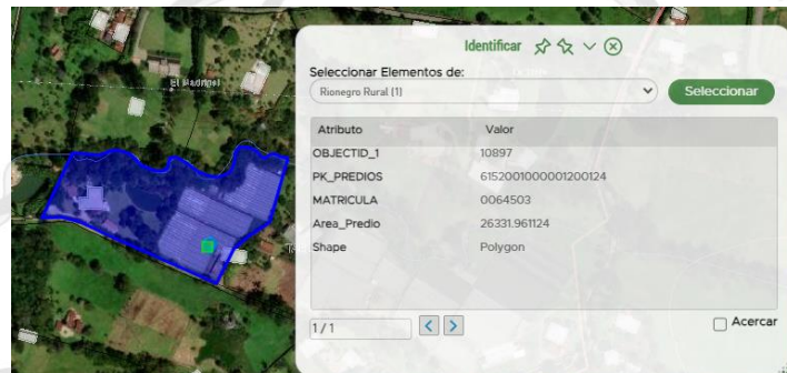
Figura 1. Ubicación Predio con FMI 020-64503

3.4 El predio identificado con FMI 020-64503 y pk 6152001000001200124 de acuerdo al Sistema de Información Geográfica de Cornare se encuentra ubicado en la Vereda Tablacito del municipio de Rionegro, cuenta con un área total de 2.6 Ha según el Geoportal.